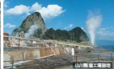
山川製塩工場跡地