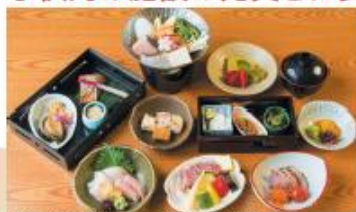
夕食一例【但馬牛ミニステーキ付季節の会席プラン】