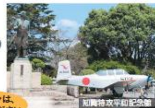
知覧特攻平和記念館

安心サポート料金 専門のヘルパーが柔軟に対応いたします。介助人派遣料金(介助内容:入浴・食事)▶1時間...4,500円～(指宿温泉プラン)